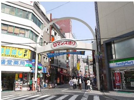
ロマンス通りの先にあるよん。

いまは、北陸のナルゾウさんが好きなDVDとかをこの近所で販売していることでも有名らしいです。